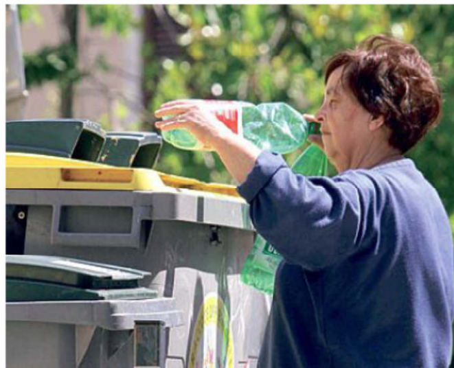
Nel Valdarno fiorentino l'obiettivo è l'80% di raccolta differenziata

«MENO MALE che ad alzare un po' la media della raccolta diffe-